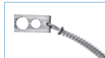
detalhe do DSF